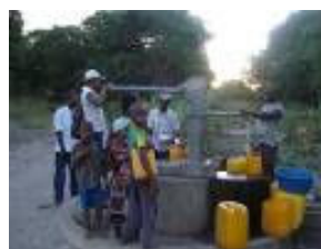
Criar capacidade local