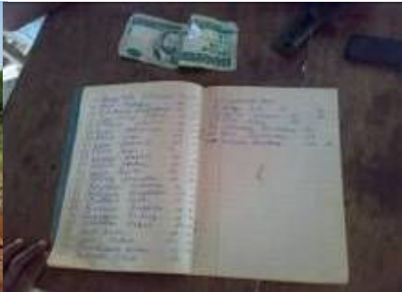
Modelos alternativos de financiamento de O & M e mecanismos de responsabilização