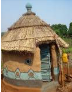
Soluções locais Pertença local