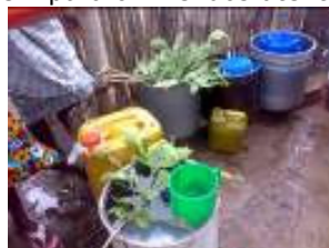
Da bomba ao copo