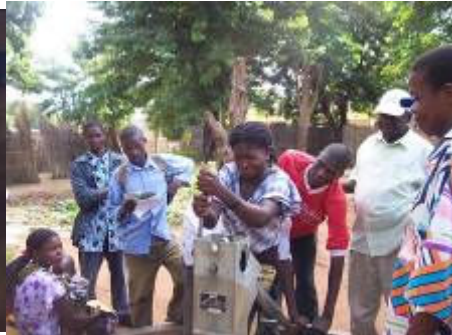
Capacitação em todos os níveis através de abordagens não-convencionais